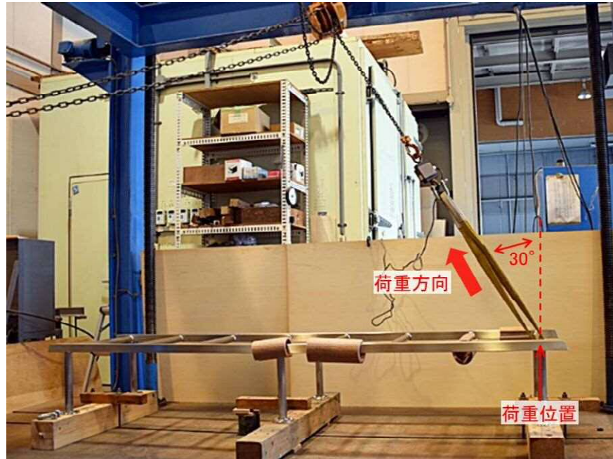
図3 斜め方向耐荷重試験状況（端）

鉛直方向耐荷重試験と同様に水平な定盤上に上下を反転して固定したステンレス雲梯について、最も端の横棒（図1の⑧）に対し鉛直上向きから30°傾けた斜め上方向に2.94kN（300kgf）の荷重を負荷し、目視により顕著な変形や破壊がないことを確認した。続いて端から3番目の横棒（図1の⑥）に対しても同様の試験を行った。それぞれの試験状況を図3と図4に示す。