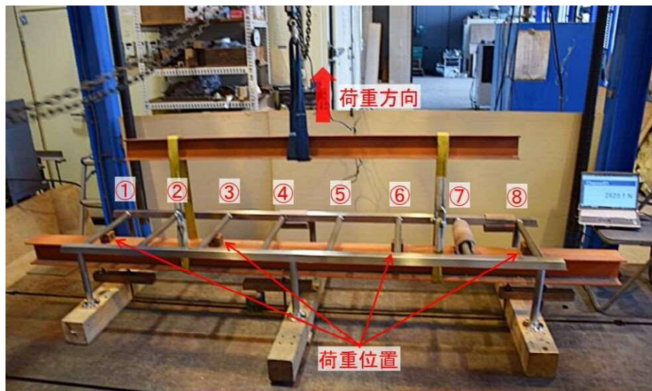
図1 鉛直方向耐荷重試験状況（正面から）